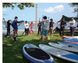
SUP講師:(SurfUp島根専属インストラクター)

※ビーチコーミングは、浜 辺に打ち寄せられた貝殻や シーグラスなど漂流物を拾 って集めることです。