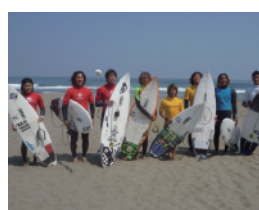
サーフィン講師:(SurfUp島根専属インストラクター)

定員:10名 参加費:3,850円(保険料込) 雨天会場:波根中央集会所 時間:8:00～9:30くらい