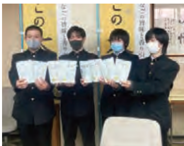
*完成品を市長へお披露目しました。

大田高校2年生の地域探究学習で、観光課題の解決に取り組んだ生徒たちが、株式会社魚の屋の協力を得て、大田市の新たなお土産、その名も「あなごの大だし」(アナゴ出汁パック)づくりに取り組みました。