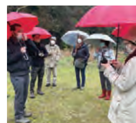
英語ガイド研修の様子

近年の外国人旅行者の傾向として、団体旅行よりも個人旅行、都会よりも田舎が好まれる傾向にあります。日本ならではの文化や体験など、本当に興味あるモノやコトを、自由に満喫したいという旅行者が増えているのです。