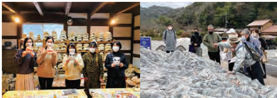
モニターツアーの様子