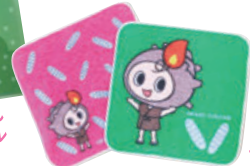
らとちゃん ミニタオルハンカチ

大田市観光協会が運営する各販売所(石見銀山おみやげ処、石見銀山みやげJR大田市駅店、温泉津ゆうゆう館)にて販売しています!