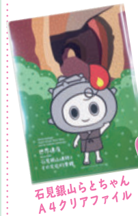
石見銀山らとちゃん A4クリアファイル

大田市観光協会が運営する各販売所(石見銀山おみやげ処、石見銀山みやげJR大田市駅店、温泉津ゆうゆう館)にて販売しています!