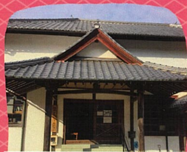
大森町並み交流センター