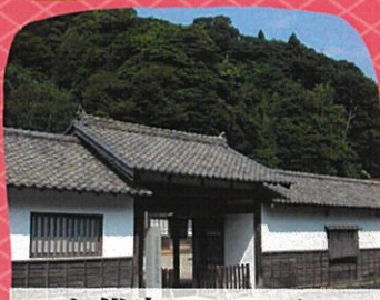
いも代官ミュージアム 石見銀山資料館