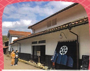
重要文化財熊谷家住宅