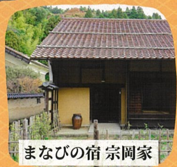
まなびの宿 宗岡家