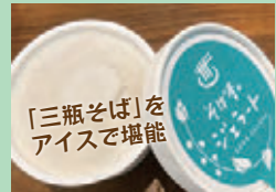
湯上りには、三瓶そばを使った「そばアイス」をご用意。そば粉の風味を閉じ込めた甘さ控えめアイスは格別です。