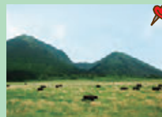
▲三瓶山の牧野景観