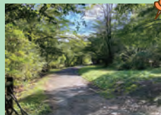
▲ヘルシートレイリングコース