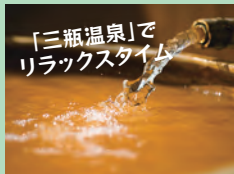
E-BIKEで巡った後は、中国地方最大の湧出量を誇る三瓶温泉の“ぬる湯”でリラックスタイム。