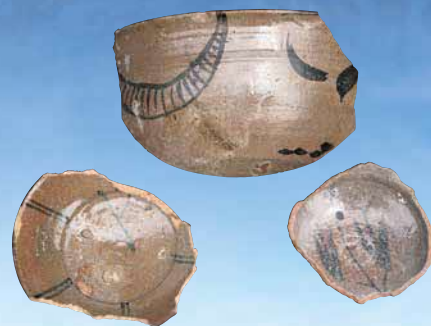
器を愛でた風流人を想う(絵唐津／17世紀) (展示会場:ゆう・ゆう館)