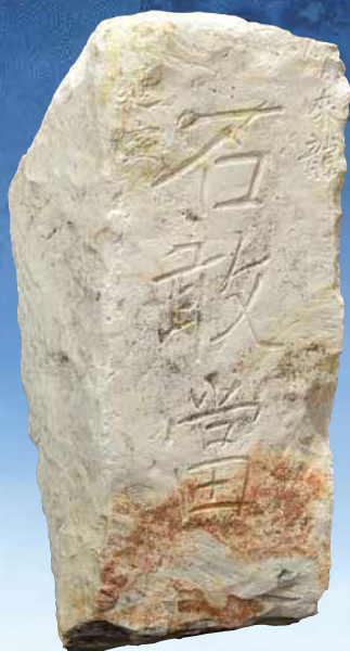
南島の祈りを刻む石造物(石敢當／17世紀) (展示会場:いも代官ミュージアム)