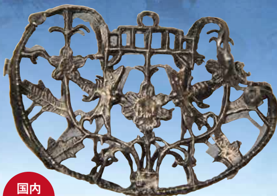
よみがえる異国の美(長命鎖／17世紀) (展示会場:石見銀山世界遺産センター)