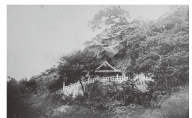
龍御前神社の古写真

[会場]ゆう・ゆう館(大田市温泉津町温泉津イ791-4) [開館時間]8:45~17:30 [入館料]無料 [会期中の休館日]無休 [お問い合わせ先]0855-65-2065