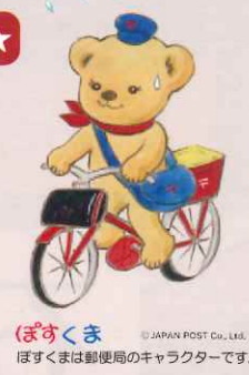
ぼすくま © JAPAN POST Co., Ltd. ぼすくまは郵便局のキャラクターです。

大森町外 大田市観光案内所 (ごいせ仁摩・大田市駅・温泉津) ※ 10 大森観光案内所と同じスタンプです