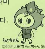
5ちゃん ©2012 大田市 5ちゃん 051

「이와미긴잔(은광)유적과 그 문화적 경관」은 2007년 7월에 유네스코의 세계유산으로 등록되었습니다. 오다시는 유네스코의 「세계평화와 인권존중」 정신에 입각하여 세계유산 「이와미긴잔유적과 그 문화적 경관」의 보전과 활용을 추진하고 있습니다.